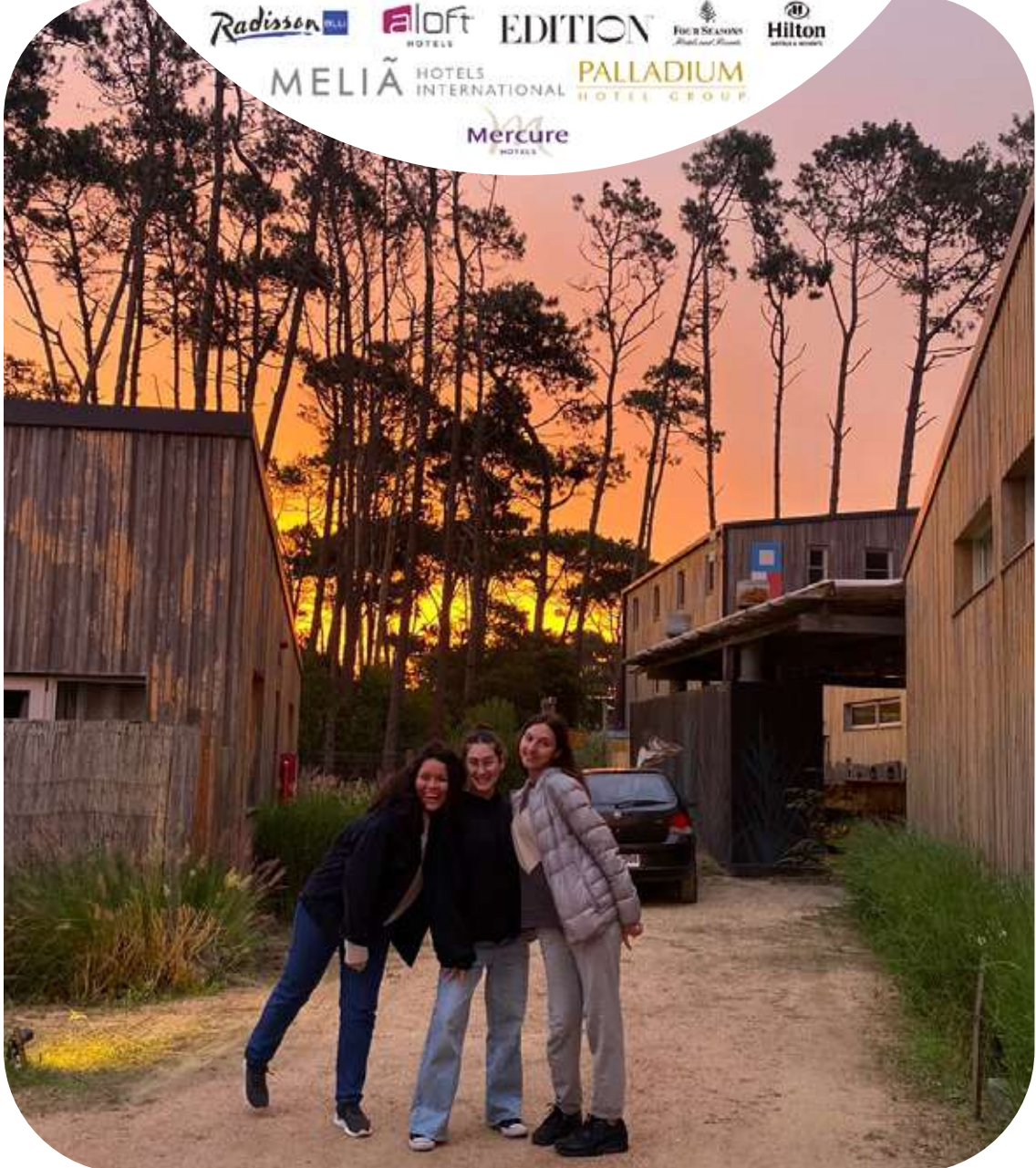
Atardecer "pasantía Vik Uruguay".

Los estudiantes pueden realizar sus pasantías internacionales de 3 a 4 meses entre diciembre y marzo del primer y segundo año. Una vez concluido el tercer año, pueden hacerlas de hasta 12 meses. Los destinos más elegidos son Europa, EEUU y Sudamérica.